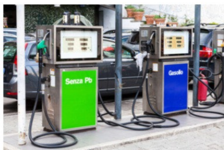
Le accise sulla benzina non aumenteranno

Il Decreto Aiuti Quater ha deciso di prorogare il taglio delle accise che scadeva il 18 novembre, ma il prezzo della benzina, stando ai rilievi di dell'osservatorio prezzi del ministero della infrastrutture stanno calando, comunque perché si riducono i prezzi alla fonte. C'è chi poi come Eni ha deciso ai propri distributori di far pagare la benzina due centesimi in meno del prezzo raccomandato.